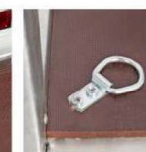
Петли крепления груза

Салон мототехники ТСК Мотор - г. Киров, ул. Московская, 166Б; тел. (8332)621-000; e-mail: moto@motor92.ru