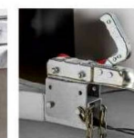
Кронштейн регулировки высоты сцепного устройства