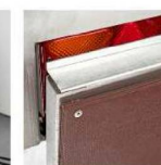
Усиленный задний борт