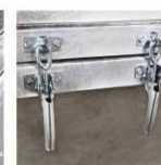
Защелки функции «самосвал»