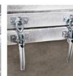
Защелки функции «самосвал»