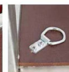
Петли крепления груза

Салон мототехники ТСК Мотор - г. Киров, ул. Московская, 166Б; тел. (8332)621-000; e-mail: moto@motor92.ru