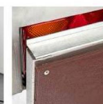
Усиленный задний борт