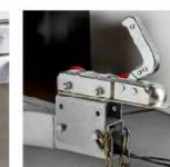
Кронштейн регулировки высоты сцепного устройства