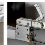
Кронштейн регулировки высоты сцепного устройства