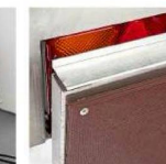
Усиленный задний борт