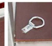
Петли крепления груза

Салон мототехники ТСК Мотор - г. Киров, ул. Московская, 166Б; тел. (8332)621-000; e-mail: moto@motor92.ru