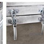
Защелки функции «самосвал»