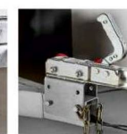
Кронштейн регулировки высоты сцепного устройства