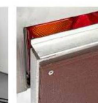
Усиленный задний борт