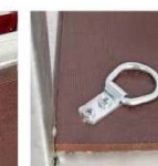
Петли крепления груза

Салон мототехники ТСК Мотор - г. Киров, ул. Московская, 166Б; тел. (8332)621-000; e-mail: moto@motor92.ru