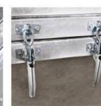
Защелки функции «самосвал»