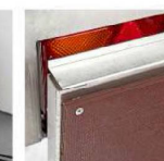
Усиленный задний борт