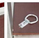
Петли крепления груза