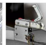
Кронштейн регулировки высоты сцепного устройства