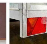
Импортная светотехника в полускрытой балке